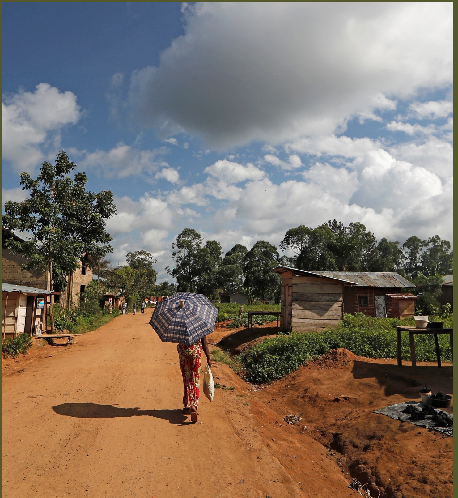
Fiche 2.4. La République Démocratique du Congo